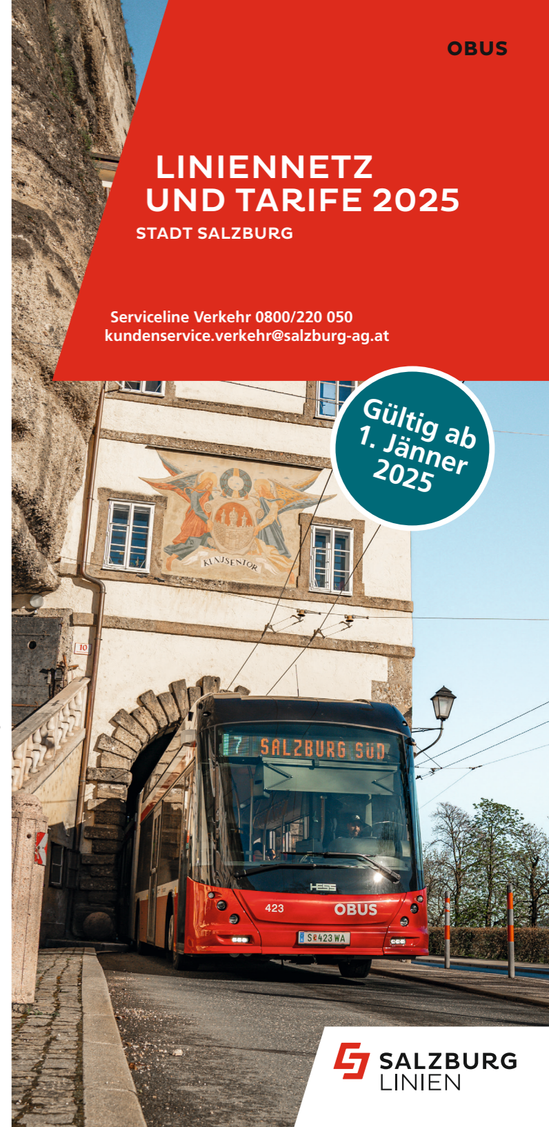
Salzburg Linien Verkehrsbetriebe GmbH, Stand Jänner 2025, Druckfehler und Irrtümer vorbehalten.